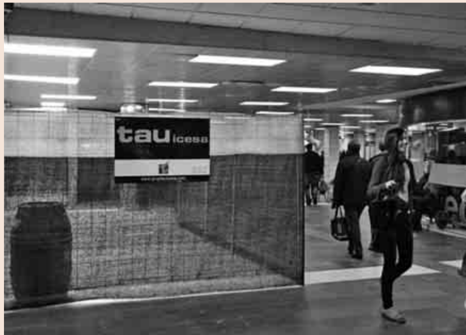
Una obra de Tau Icesa en el vestíbulo de Renfe de la estación de Plaça Catalunya de Barcelona.

Otra medida que ha puesto en marcha la constructora para continuar su actividad tras el concurso es el adelgaza-