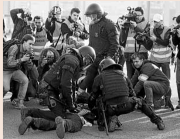
PROTESTAS UNIVERSITARIAS POR LOS RECORTES Un grupo de incontrolados ensombreció la manifestación de los estudiantes el pasado miércoles. Los congresistas del MWC fueron testigos de escenas lamentables en la Plaza España.